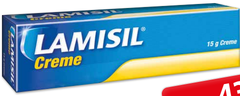
Lamisil Creme* 15 g

43 % gespart 3 AAP 1 11,58 € 6,50 € 1 kg = 433,33 €