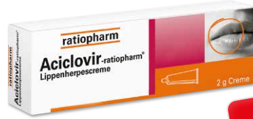
Aciclovir-ratiopharm Lippenherpescreme* 2 g

47 % gespart 3 AAP 1 7,50 € 3,95 € 1 kg = 197,50 €