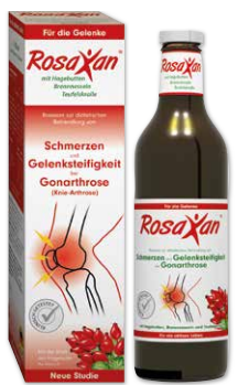
Rosaxan 750 ml

28 % gespart 3 UVP 2 24,90 € 17,80 € 1 l = 23,73 €