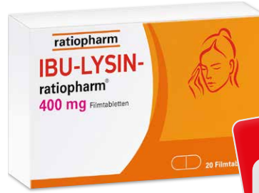
Ibu-Lysin-ratiopharm 400 mg* 20 Tabletten