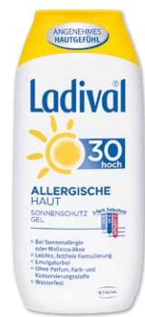
Ladival allergische Haut Gel LSF 30 200 ml

28 % gespart 3 UVP 2 24,90 € 17,80 € 1 l = 23,73 €