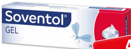
Soventol Gel* 20 g

47 % gespart 3 AAP 1 7,50 € 3,95 € 1 kg = 197,50 €