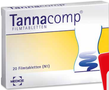
Tannacomp* 20 Tabletten

45 % gespart 3 UVP 2 5,41 € 2,95 € 1 kg = 1.475,00 €