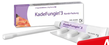
KadeFungin 3 Kombipackung* 20 g Creme + 3 Vaginaltabletten

43 % gespart 3 AAP 1 11,58 € 6,50 € 1 kg = 433,33 €